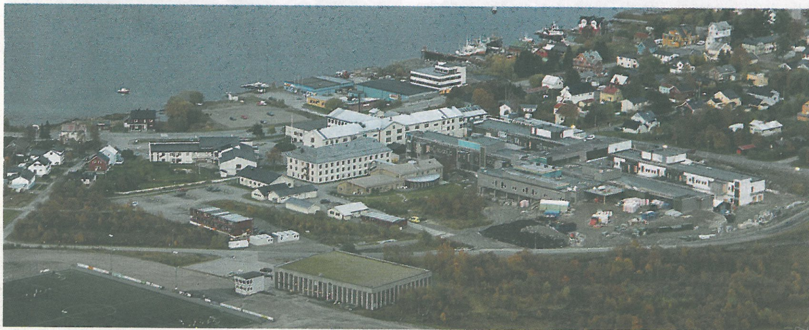
Nysykehuset, som vi her ser tidlig i byggeprosessen, ligger rett bak det gamle sykehuset. Størsteparten av den gamle bygningsmassen skal rives.