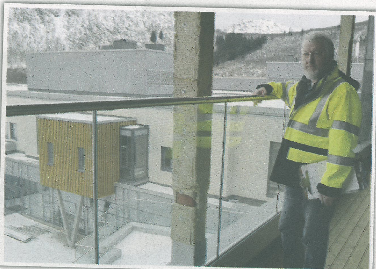
Atriene bidrar til romfølelse og luftighet.